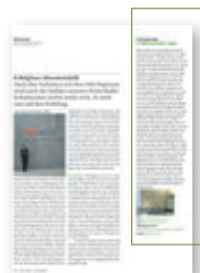
1/3 Seite, 4-farbig

Präsentieren Sie Ihre Neuheiten in unserer Rubrik «Publireportagen». Sie liefern uns Text und Bildmaterial. Das Redigieren, Setzen und Gestalten übernehmen wir für Sie. Nutzen Sie das kompetente redaktionelle Umfeld und präsentieren Sie Ihre Firma, Ihre Produkte, Ihre Dienstleistungen in Form einer «Publireportage».